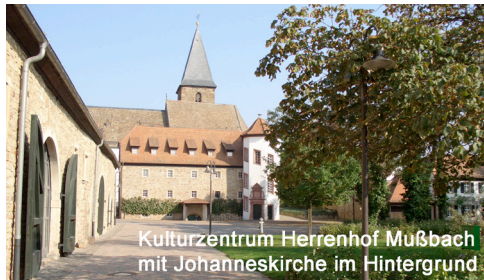
Kulturzentrum Herrenhof Mußbach mit Johanneskirche im Hintergrund

Die 5. Internationale Frühlingsakademie findet im reizvoll gelegenen Herrenhof in Neustadt an der Weinstraße, Ortsteil Muß-