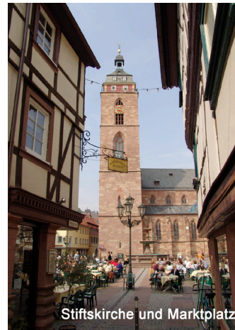
Stiftskirche und Marktplatz

The Hambacher Schloss (the so called “Cradle of German Democracy”), the Castle of Heidelberg and the Cathedral of Speyer are all popular local attractions. Wine and viticulture not only shape the landscape but also influence the mentality of the people in Neustadt. Their ‘joie de vivre‘ is infectious as is their heartfelt hospitality. They look forward to being the proud hosts