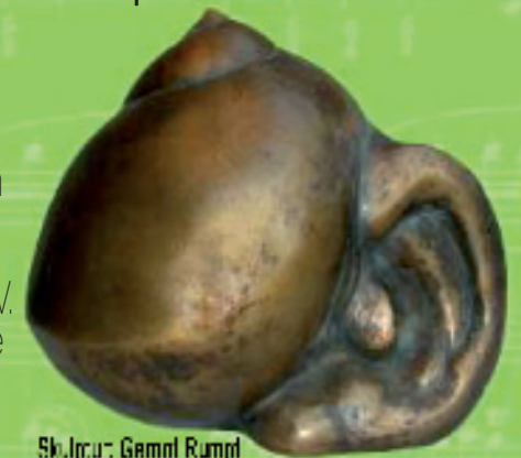
Skulptur: Gemal Rumpf

Frühlingsakademie für Streicher e.V. 67435 Neustadt an der Weinstraße